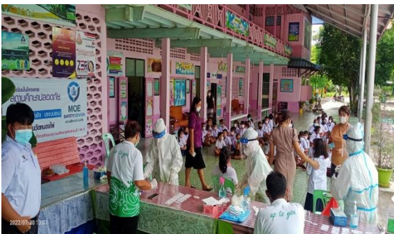
โครงการตรวจเชิงรุกเด็กปฐมวัย