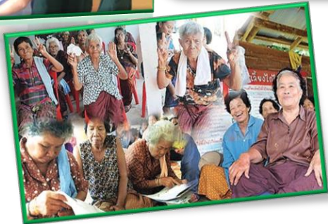
กองทุนหลักประกันสุขภาพ องค์การบริหารส่วนตำบลหนองผักนาก