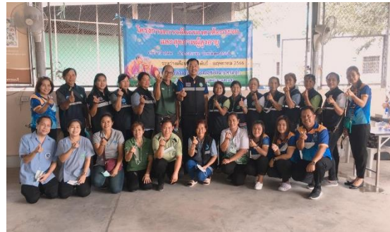
โครงการตรวจคัดกรองต่อกระดูกและตรวจสุขภาพผู้สูงอายุ