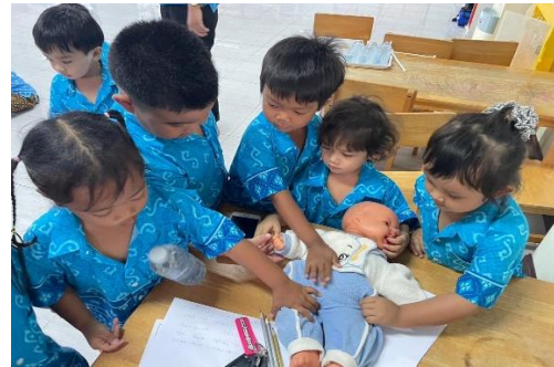
กิจกรรมการตรวจสุขภาพปากและฟันในเด็กอนุบาล