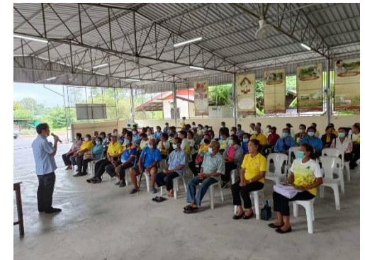
โครงการส่งเสริมสุขภาพในผู้สูงอายุ