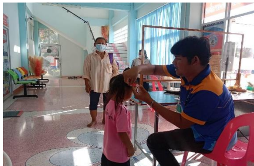
กิจกรรมรณรงค์ตรวจคัดกรองพัฒนาการเด็กปฐมวัย ๕ ช่วงวัย