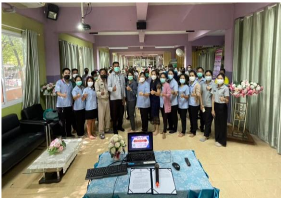
โครงการ สร้างสุขภาพดี วิถีใหม่ วิถีธรรม วิถีไทย วิถีเศรษฐกิจพอเพียง