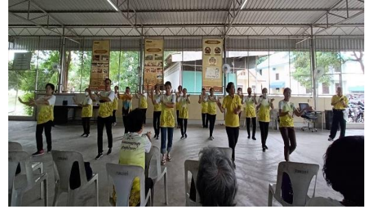
กิจกรรมชมรมผู้สูงอายุตำบลหนองผักนาก