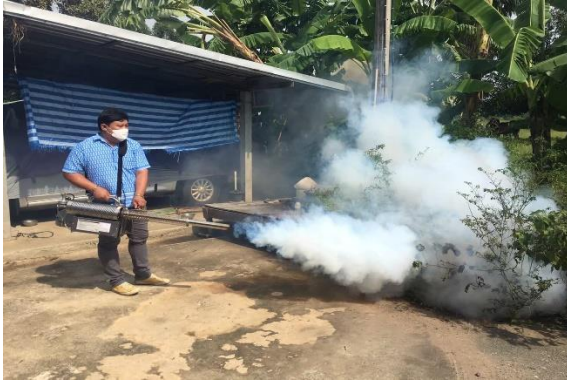
โครงการป้องกันและระงับโรคติดต่อมาโดยแมลง